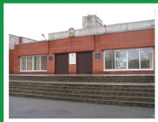
СПб ГБПОУ «Электромашинно- строительный колледж»

РАБОТЫ НА ТОКАРНЫХ УНИВЕРСАЛЬНЫХ СТАНКАХ